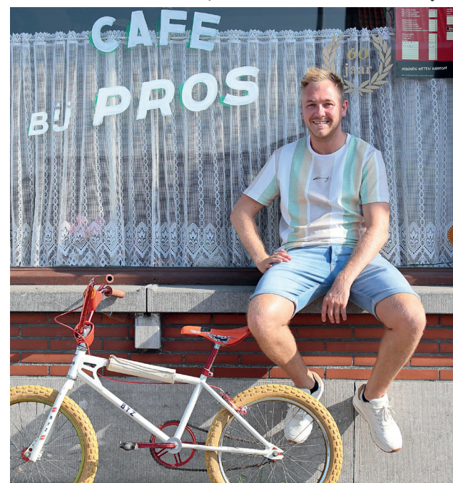
De bekende fiets en het café 'Bij Pros' in Nieuwerkerken waar een aantal scènes zijn opgenomen

In Cannes heb ik ook gemerkt dat de show-business een andere wereld, als het ware een