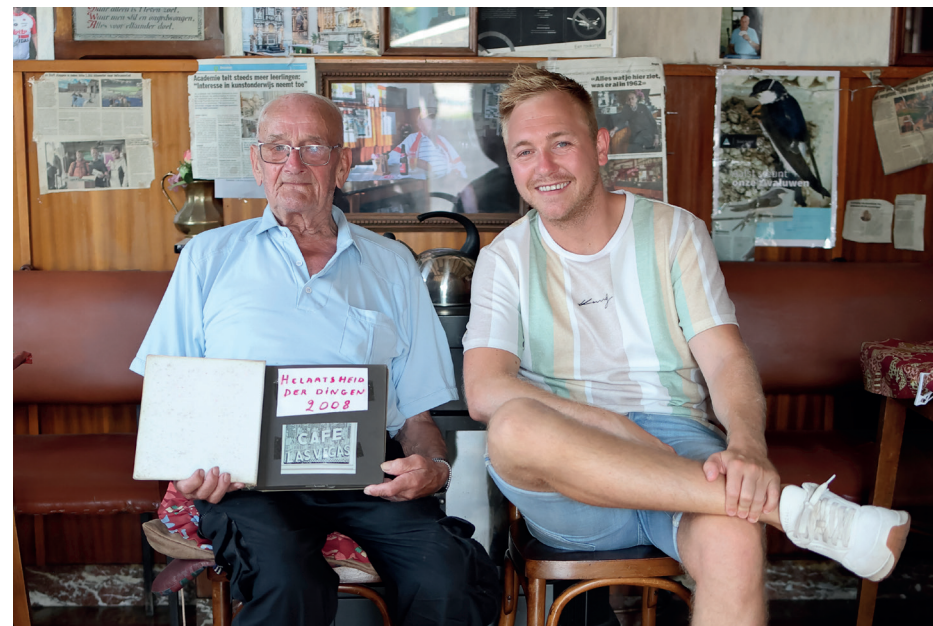
Foto met de huidige cafébaas en plakboek met foto's van de filmopnames

En via mijn tweede grote passie, voetballen, zit ik in een ploeg met bekende figuren en spelen we regelmatig een wedstrijd voor – what's in a name – het goede doel. Ik heb trouwens ook twee jaar deel uitgemaakt van het team van KOMAK, dat is een vereniging 'ouders ondersteunen kinderen met kanker'. Dat lag me heel na aan het hart want, hoe klein mijn bijdrage daarin ook was, je deed iets voor mensen die nood hadden aan fysieke en mentale steun. Voetbal is